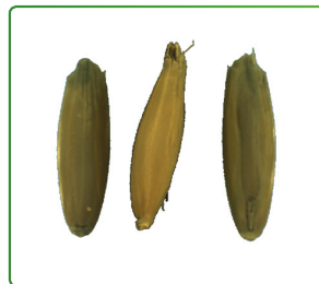
La figure 2 montre le côté le plus fin de l'amande, mesuré en vue centrale.

Dans les systèmes conventionnels à plat sur bande transporteuse avec analyse d'image, seule la longueur et la largeur de la graine sont obtenues.