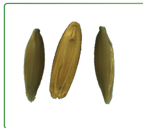
La figure 1 montre l'amande d'avoine orientée de manière que le côté le plus fin est représenté sur la vue latérale.

Des corrections pour la rotation de la graine peuvent être effectuées pour mesurer les côtés les plus fins et les plus épais de l'ensemble de l'échantillon.